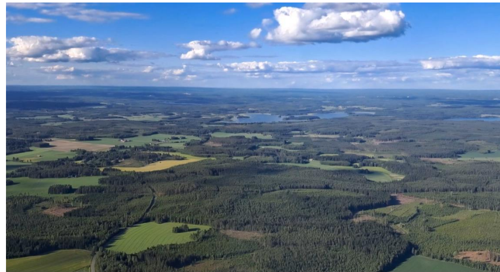
EFHK – EFVA – EFHK 15.6.2024

Kohti kesää ja toivottavasti hyviä lentosäitä. Turvallisia lentoja ja kiitos kaikille osallistujille!